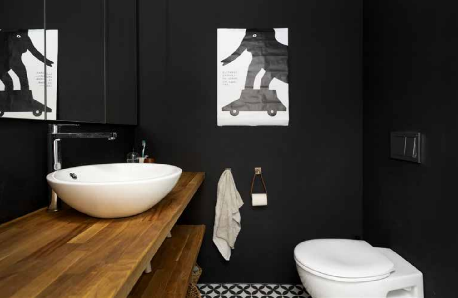
På jentene sitt bad er det lagt decor fleur noir-fliser med et geometrisk sort/hvitt mønster på gulvet, det gir en morsom kontrast i rommet.