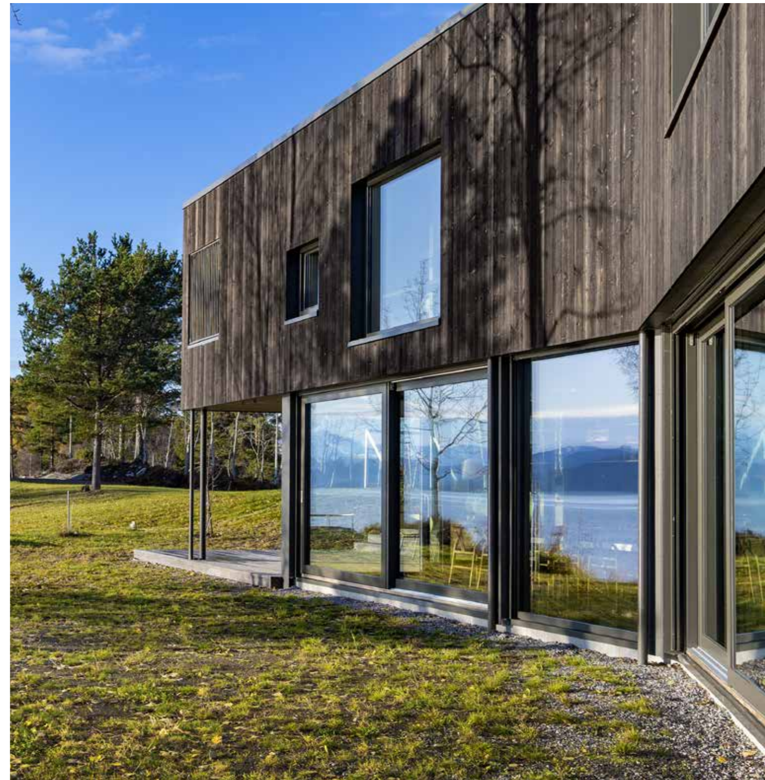
Familien valgte Nordvestvinduet, en solid leverandør av aluminiumsmantlede trevinduer da de skulle velge vinduer og dører i yttervegg. På andre plan er vinduene levert i hvitlaset furu, tilsvarende tak og vegg. På første plan er vinduene i RAL 7022 innvendig og utvendig. Denne fargen er ikke like hard som sort og står fint til fibersementplatene.