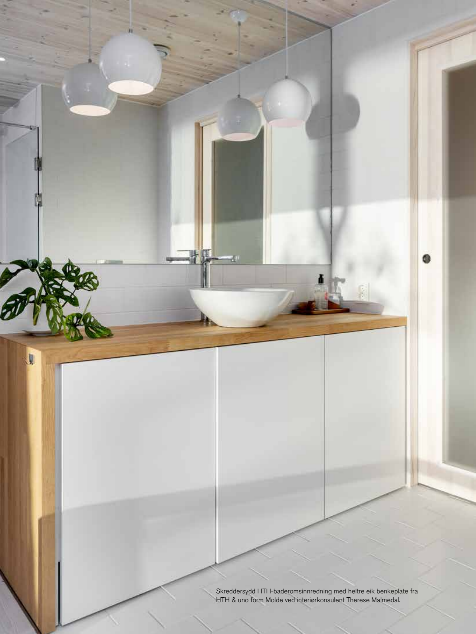
Skreddersydd HTH-baderomsinnredning med heltre eik benkeplate fra HTH & uno form Molde ved interiørkonsulent Therese Malmedal.

På hovedbadet har familien valgt hvite, enkle fliser fra Vitra som er lagt i forbandt mønster på vegger og gulv. Fliseksperten har levert fliser til boligen og utført flisleggingen. Familien hadde hørt positiv omtale om dem og deres håndverk fra flere hold.