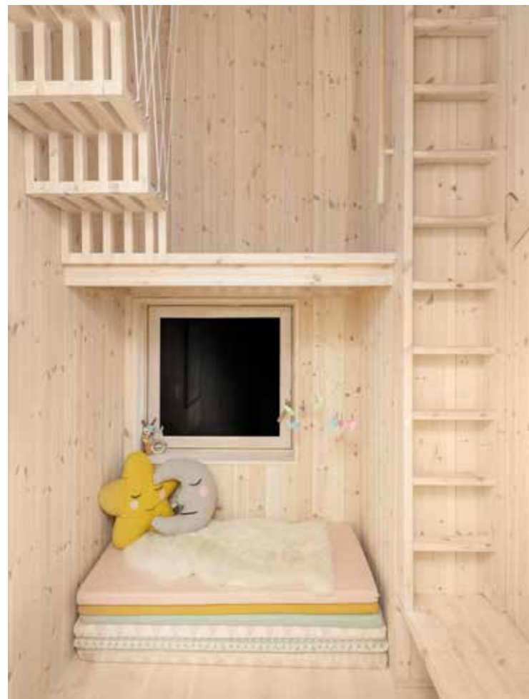
"MELBY SNEKKERVERKSTED HJALP OSS Å UTVIKLE EN MORSOM TRAPPEVARIANT OPP TIL SOVEHEMSEN PÅ ROMMET TIL DATTEREN VÅR"