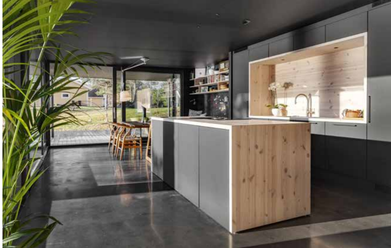
Skapdørene på fronten av kjøkkenøya er spesialtilpasset så de går helt ned til gulvet. Dette gir et renere uttrykk.