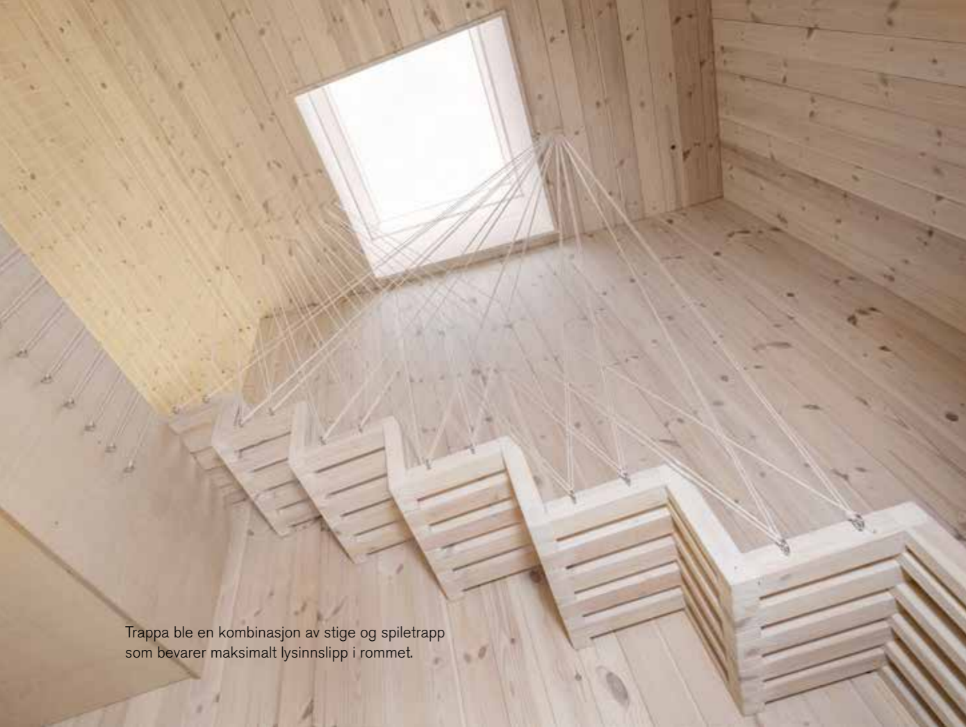
Trappa ble en kombinasjon av stige og spiletrapp som bevarer maksimalt lysinnslipp i rommet.